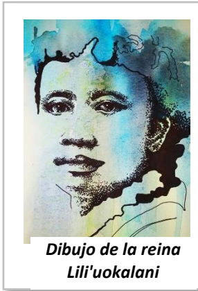
Dibujo de la reina Lili'uokalani